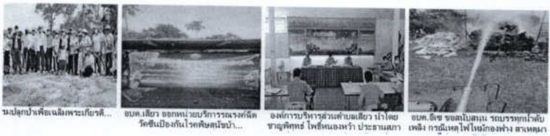
ขุดลอกป่าเพื่อเฉลิมพระเกียรติ... สมทบเสียว ออกหน่วยบริการทางการแพทย์ ริชชีเมืองกันโรคพิษสุนัขบ้า... องค์การบริหารส่วนตำบลเสียว นำโดย ชาวนิติคุณ โพธิ์หนองหว้า ประธานเสียว สมทบ. อีเซ ซอตโบสถน รอดรรทุกไผ่ลับ เพลิง การดีเทคโนโลยีใหม่กองช่าง สาเหตุ