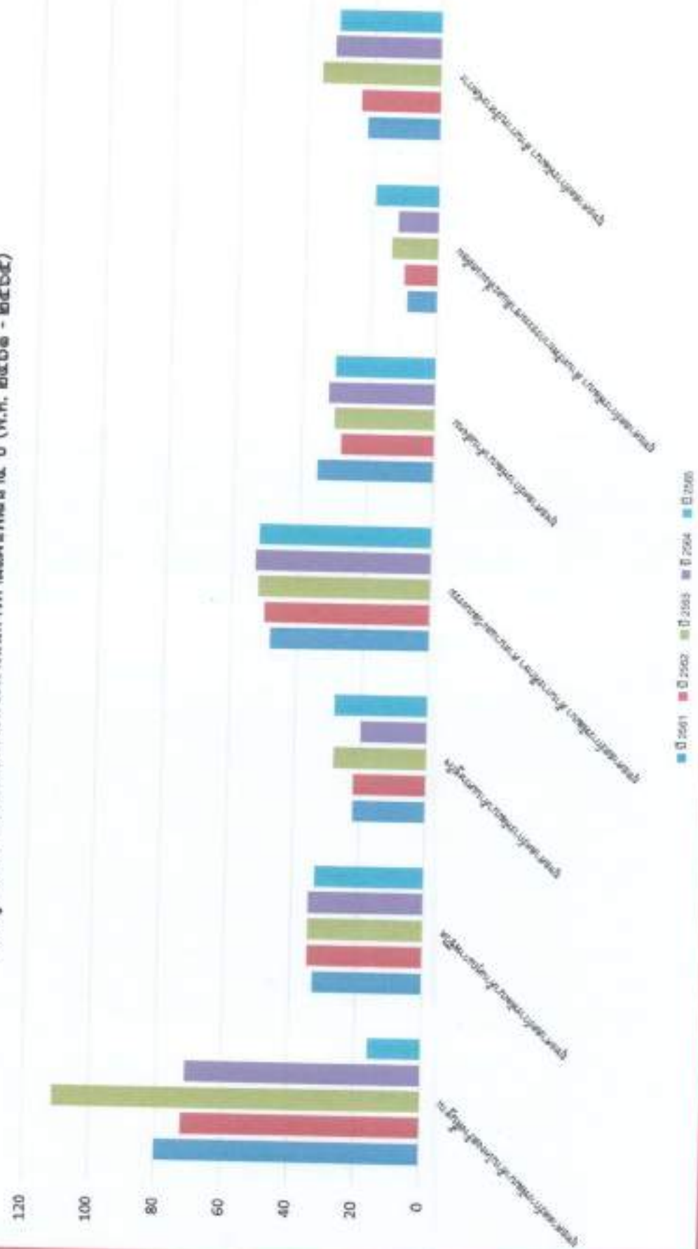
แผนภูมิแสดงจำนวนโครงการที่ดำเนินการตามแผนพัฒนา ๕ ปี (พ.ศ. ๒๕๓๕ - ๒๕๓๙)